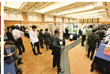
ブース展示の様子