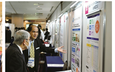
ブース展示の様子