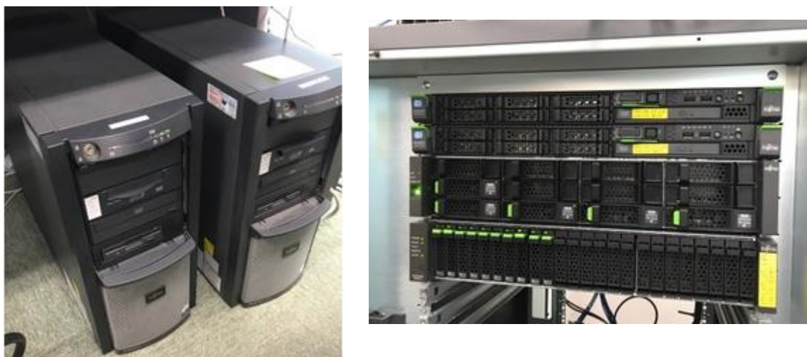
図 3. 典型的な Web/DB 構成の事務系システム(左)と集約後のプライベートクラウド(右)

ため性能面に不安がある、4. 仮想環境での構築の実績が乏しいなどがあった。これについては各システムのベンダーにシステム構成や既に稼働しているシステムの実績を公開し、地道に各業者に理解いただくようにした。